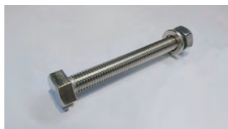
○ステン六角ボルトナットワッシャー